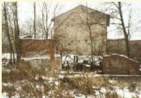
Młyn nad Myją

GOK jest także organizatorem cyklicznych imprez, takich jak „Przeгляд Piosenki Biesiadnej” na przełomie stycznia i lutego, oraz „Dni Gminy Wróblew” – czerwiec, lipiec. Imprezy te mają na celu przybliżenie gminy turystom i kultywowanie tradycji.