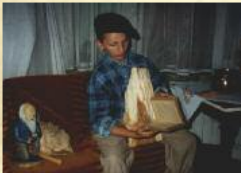
Przedstawienie w bibliotece

organizuje także rajdy rowerowe po naszej gminie, zbiera stare fotografie, które potem wykorzystuje do wydawania kalendarzy czy przygotowywania prezentacji multimedialnych. Na swoim koncie ma też przedstawienia teatralne, konkursy fotograficzne ukazujące naszą gminę, plastyczne, pielęgnujące naszą obyczajowość i tradycję. Tutaj też działa Punkt Informacji Europejskiej, który w swej działalności wykorzystuje materiały gromadzone samodzielnie i te dostępne na stronach internetowych. Wiele cennych materiałów dostarczył placówce Urząd Komitetu Integracji Europejskiej, przesyłając książki, broszury i dokumenty elektroniczne.