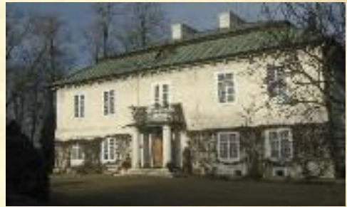
Dwór w Tubądzinie

ski i inczewski przejął niemiecki rządca Mauve Lutz, a dwór stał się ośrodkiem dla młodzieży z Hitlerjugend. Lata okupacji przyniosły wielkie straty i zniszczenia tubądziniego dworu. Po remoncie przeprowadzonym w latach 1973-1984 dwór stanowiący własność Muzeum Okręgowego w Sieradzu otrzymał nazwę Muzeum