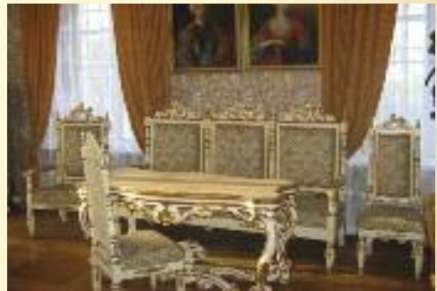
Salon w pałacu w Tubądzinie

Dwór położony jest w centrum parku krajobrazowego o powierzchni 3,2 ha, o zarysie zbliżonym do trójkąta. Od strony zachodniej park przylega do drogi, od północno-