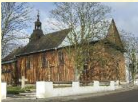
Kościół pw. św. Piotra i Pawła we Wróblewie

nych regionów Rzeszy. We Wróblewie w połowie stycznia 1940 roku Niemcy rozpoczęli akcję wysiedlania chłopów z lepszych gospodarstw. Wywieźli wtedy 72 rodziny z Wróblewa, sprowadzając na ich miejsce Niemców z Wołynia. We Wróblewie istniał posterunek żandarmerii niemieckiej, która pacyfikowała okoliczne wioski, a funkcjonariusze dokonywali morderstw na mieszkańcach. Wyzwolenie nastąpiło dnia