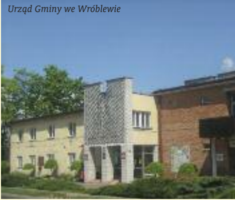
Urząd Gminy we Wróblewie