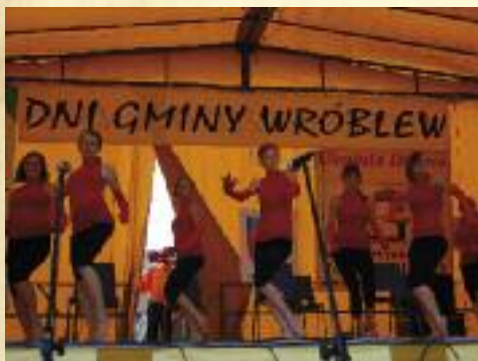
Dni Gminy Wróblew

organizuje także rajdy rowerowe po naszej gminie, zbiera stare fotografie, które potem wykorzystuje do wydawania kalendarzy czy przygotowywania prezentacji multimedialnych. Na swoim koncie ma też przedstawienia teatralne, konkursy fotograficzne ukazujące naszą gminę, plastyczne, pielęgnujące naszą obyczajowość i tradycję. Tutaj też działa Punkt Informacji Europejskiej, który w swej działalności wykorzystuje materiały gromadzone samodzielnie i te dostępne na stronach internetowych. Wiele cennych materiałów dostarczył placówce Urząd Komitetu Integracji Europejskiej, przesyłając książki, broszury i dokumenty elektroniczne.