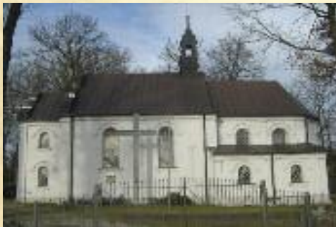
Kościół pw. św. Wawrzyńca w Tubądzinie

Dwór w Tubądzinie zajął V miejsce w konkursie „Perły w Koronie Województwa Łódzkiego 2009”.