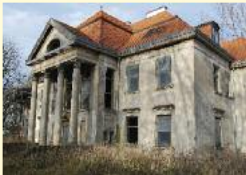
Niszczący dwór w Inczewie

Znajduje się tutaj piętrowy dwór z początku XIX wieku. W latach 1906-1908 poddano go gruntowej przebudowie, nadając mu cechy stylu neoklasycystycznego. Z zewnątrz od strony południowej budowlę przyozdobiono czterokolumnowym portykiem. Kolumny