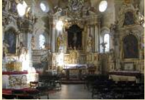
Ołtarz główny w kościele pw. św. Klemensa w Wąglczewie

Od XV wieku do 1818 roku parafia Wąglczew jako wieś królewska przynależała do archidiecezji gnieźnieńskiej.