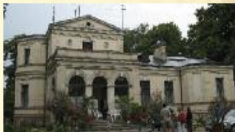
Dwór w Kobierzycku

Wieś położona w odległości 10 km na zachód od Sieradza, w pobliżu szosy do Kalisza.