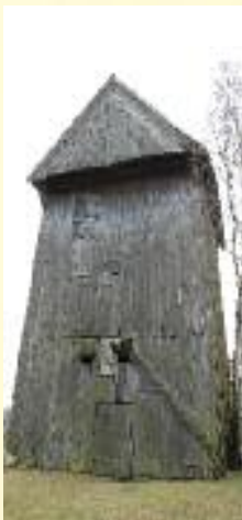
Wiatrak typu „koźlak”