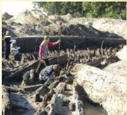
Grodzisko z XIV w. w Charłupii Wielkiej-odkryte podczas budowy zbiornika Smardzew

Zbiornik wodny będzie drugim co do wielkości, po Jeziorsku (4200 ha), w naszym regionie. Ma mieć minimalnie 60 ha powierzchni, a maksymalnie nawet 65. Jego głębokość ma dochodzić do 4,5 metra, zaś długość zapory czołowej 369 metrów. Po zaprze przebiegać będzie droga powiatowa, mająca ponad 1200 metrów. Prace nad budową zbiornika mają potrwać do 2012 roku. Zbiornik Smardzew będzie wspólnym miejscem do wypoczynku i rekreacji dla wszystkich szukających wytchnienia od dnia codziennego.