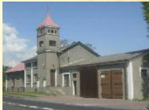
Ochotnicza Straż Pożarna we Wróblewie

W Gminie Wróblew funkcjonują jednostki Ochotniczych Straży Pożarnych: OSP Bliźniew, OSP Charłupia Wielka, OSP Drżązna, OSP Dziebędów, OSP Inczew, OSP Kobierzyczo, OSP Kościerzyn, OSP Oraczew, OSP Rowy, OSP Sadokrzyce, OSP Sędziwe, OSP Słomków Mokry, OSP Słomków Suchy, OSP Smardzew, OSP Tubądzin, OSP Wąglczew, OSP Wróblew.