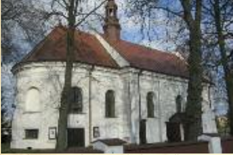
Kościół pw. św. Bartłomieja w Charłupi Wielkiej

„Pęknięty dzwon”. Obecna na jego pogrzebie (1925 r.) delegacja mieszkańców wsi złożyła na grobie wieniec z napisem na szarfi: „Swemu przyjacielowi – chłopci z Sieradzki”.