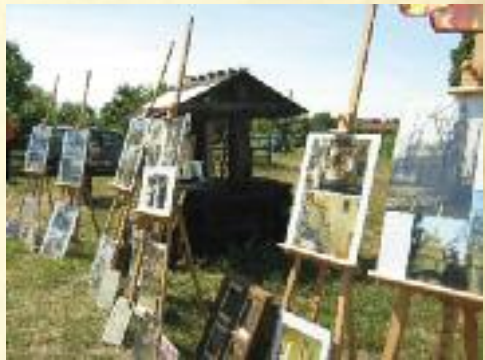
Gmina Wróblew wczoraj i dziś - wystawa fotografii zorganizowana przez GBP we Wróblewie

Biblioteka – w pełni skomputeryzowana, oprócz zadań statutowych zajmuje się też inną działalnością kulturalną promującą gminę i samą placówkę. W cyklu „Cudze chwalicie, swego nie znacie...” zorganizowała w ciągu 10 lat 12 wystaw twórców