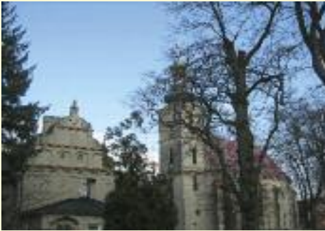
Kościół i plebania pw. św. Klemensa w Wąglczewie

Źródłowe wzmianki o Wąglczewie pochodzą z XI wieku. Na początku XII wieku była to wieś królewska. Od 1250 roku wieś, jak i zespół kościelno-klasztorny były pod opieką zakonu kanoników regularnych z Miechowa aż do połowy XIV wieku (czyli do momentu przeniesienia zakonu do Kalisza). W 1342 roku Kazimierz Wielki sprowadza do Polski zakon augustianów Najświętszej Marii Panny na Piasku i oddaje im pod opiekę Wąglczew. Zakon ten sprawował tutaj władzę do 1358 roku, do momentu kiedy oddał Wąglczew i trzy inne wsie w sieradzkim Kazimierzowi Wielkiemu w zamian za posiadłości w kaliskim. W 1359 roku znalazła się wzmianka w dokumentach informująca o istniejącym w tej wsi sołectwie.