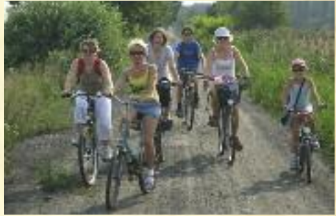
Rajd rowerowy po gminie Wróblew

Biblioteka – w pełni skomputeryzowana, oprócz zadań statutowych zajmuje się też inną działalnością kulturalną promującą gminę i samą placówkę. W cyklu „Cudze chwalicie, swego nie znacie...” zorganizowała w ciągu 10 lat 12 wystaw twórców