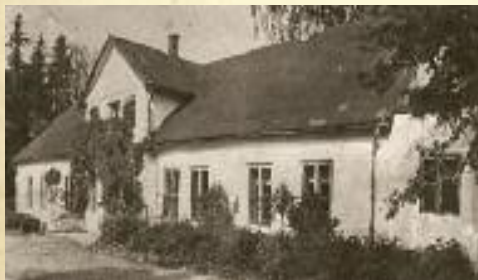
Dwór Piątkowskich w Smardzewie (spłonął w 1950 r.)