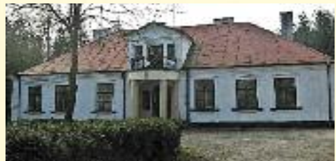
Dworek w Edmundowie

Właścicielem i założycielem majątku Edmundów był Edmund Sikorski herbu Cietrzew. Dwór został wybudowany w 1920 roku. W szczycie facjaty dworu usytuowano datę budowy, jak i herb rodowy. Po II wojnie