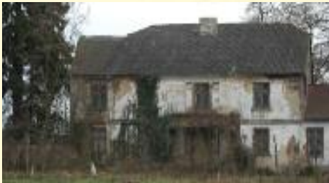
Dwór w Charłupii Wielkiej, w którym mieszkał w latach 1912-1913 W.S. Reymont