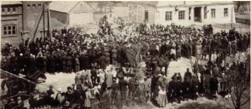
Dawny budynek Urzędu Gminy Wróblew - I poł. XX w.

1400 Źródła pisane wymieniają Smardzew po raz pierwszy, kiedy to wspomniany jest właściciel