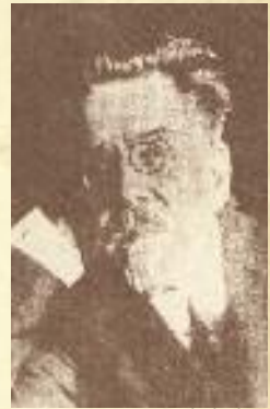
Władysław Stanisław Reymont

Podczas pobytu Reymonta w tej wiosce zaczął się ukazywać pierwszy tom trylogii pt. „Rok 1794”.