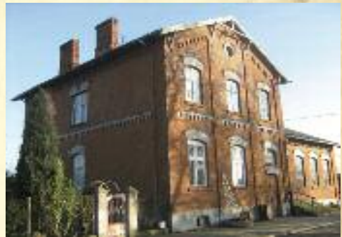
Stacja kolejowa w Sędzicach

Pierwsza wzmianka o Sędzicach według Andrzeja Ruszkowskiego pochodzi z 1397 roku. W XVI wieku był tu tylko folwark. W XVIII wieku zbudowano dwór, który przebudowano w XIX wieku. Murowany, parterowy, z mieszkalnym poddaszem. Budowla na planie prostokąta z drewnianymi alkierzami po bokach, pochodzącymi z początku XIX wieku. Dach dwuspadowy z facjatkami o trójkątnych szczytach.