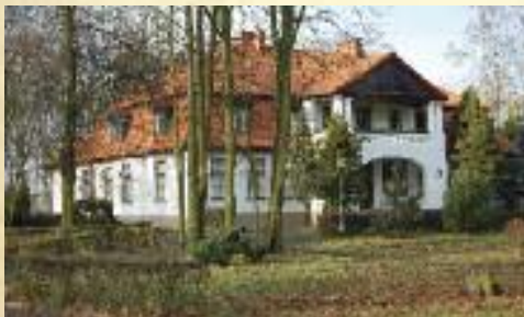
Dwór w Kościerzynie

Dzisiejszy dwór w Kościerzynie jest obiektem stylistycznie niejednorodnym. Projektant w efekcie czerpał ze stylów rozmaitych epok, głównie barokowych. (np. plan, sposób kształtowania bryły, detal architektoniczny). Dwór jest nadal ciekawym przykładem tzw. stylu narodowego. Jest jednym z lepiej zagospodarowanych budowli podworskich w powiecie sieradzkim.