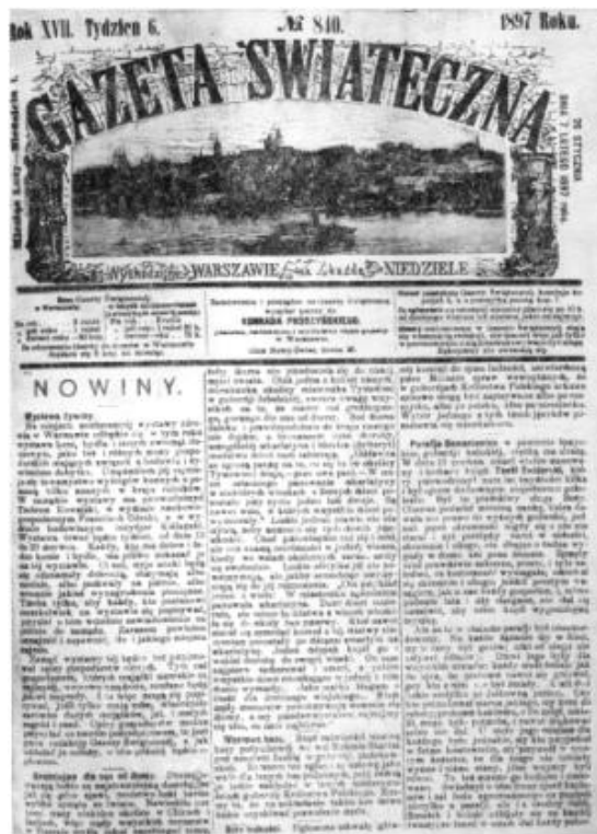
DK „Gazeta Świąteczna”, nr 848, 1897 r.

Oprócz pracy na roli interesował się własnym środowiskiem oraz tym co dzieje się w niepodległej Polsce i na świecie. Był czytelnikiem „Gazety Świątecznej” 2 , która w środowisku chłopskim zdobyła sobie wielkie uznanie 3 . Z niej dowiadywał się o innych miejscowościach, o życiu Polaków, ich problemach, zwyczajach, wierzeniach itp. Postanowił, że w podobny sposób opisze swoją parafię. W 1902 r. w czterech numerach „Gazety Świątecznej” ukazywały się jego wierszowane artykuły: