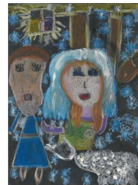
III miejsce Zofia Porada SP Słomków Mokry