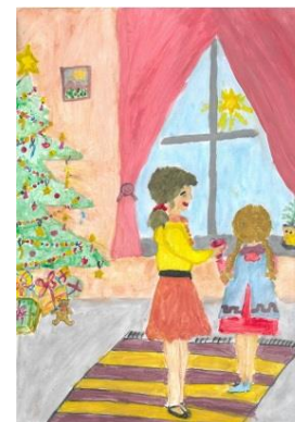
II miejsce Zofia Świniarska SP Wróblew